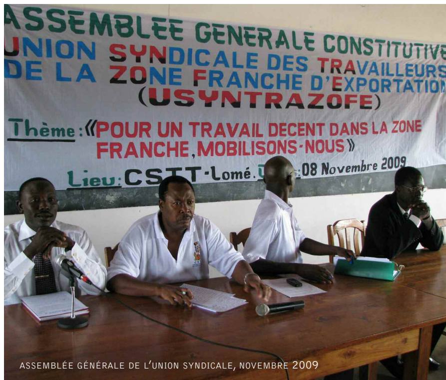
ASSEMBLÉE GÉNÉRALE DE L'UNION SYNDICALE, NOVEMBRE 2009

LE TRAVAILLEUR, NE BÉNÉFICIAIT D'AUCUNE PRISE EN CHARGE EN CAS DE MALADIE, DE DEUIL OU DE BESOIN SCOLAIRE DES ENFANTS DE LA PART DE SON SERVICE, EST EXPOSÉ À LA PRÉCARITÉ ET À UNE VIE DE MISÈRE