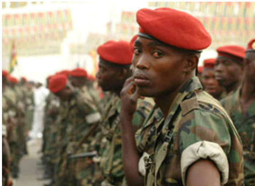
FORCES ARMÉES TOGOLAISES (FAT)

dévoilé sa vision stratégique pour la période électorale (novembre 2009 - mars 2010). Il va continuer à donner un appui constant et à coopérer avec le gouvernement, les responsables politiques, les médias et toutes les institutions appropriées, afin que les élections puissent permettre aux Togolais de s'inscrire définitivement dans une dynamique de stabilité et de reconstruction nationale. Pour ce faire le HCDH va mettre en place des antennes dans toutes les régions administratives.