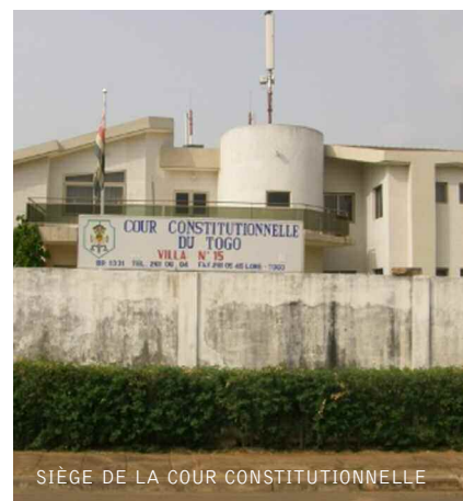
SIÈGE DE LA COUR CONSTITUTIONNELLE

Le point V de l'Accord politique global (APG), qui prévoyait la création de conditions susceptibles de faciliter la mise en œuvre des préconisations de l'accord, ont été prises avec la mise en place du Cadre permanent de dialogue et de concertation (CPDC) et du Comité de suivi des accords de Ouagadougou. Néanmoins, ces derniers n'ont jamais véritablement fonctionné, puisque toutes les crises ont été réglées au Burkina-Faso, auprès du médiateur Blaise Compaoré, et non au Togo.