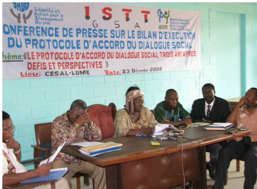
CONFÉRENCE DE PRESSE. BILAN DU DIALOGUE SOCIAL, DÉCEMBRE 2009