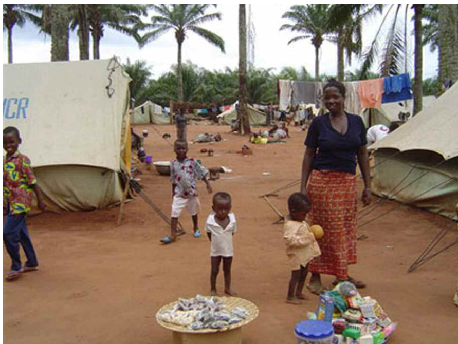
CAMP RÉFUGIÉS TOGOLAIS D'AGAME BÉNIN

2005, sont rentrés au Togo après que le gouvernement togolais a créé les conditions d'un retour apaisé. Il n'en demeure pas moins que des Togolais résident toujours dans les camps installés dans les pays voisins, en partie parce qu'ils estiment que leur sécurité n'est pas encore totalement assurée au Togo. En ce qui concerne « le pardon et la réconciliation », des efforts ont été faits par le gouvernement, mais ceux-ci demeurent insuffisants pour régler cette question lancinante qui occupe la vie politique togolaise depuis de nombreuses années. Des consultations ont été entreprises et une Commission vérité justice et réconciliation (CVJR) a été installée pour faire la lumière sur les actes de violence à caractère politique, durant la période de 1958 à 2005. En dépit des actes qui ont été posés, la question du pardon et de la réconciliation reste entière. Des actions décisives doivent maintenant être conduites pour convaincre les uns et les autres que le processus en cours rompt avec la « mystification » habituelle. Les deux autres recommandations du point II de l'APG attendent encore d'être mises en œuvre. « L'impunité » reste totale pour les auteurs de violences politiques passées. « La sécurité des biens et des personnes » reste à affirmer. Cela suppose un engagement plus ferme du gouvernement : qu'il se donne les moyens et qu'il prenne les mesures nécessaires à