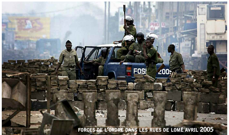
FORCES DE L'ORDRE DANS LES RUES DE LOMÉ AVRIL 2005