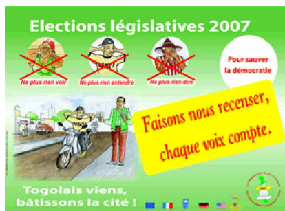
AFFICHE RECENSEMENT CENI 2007

fonds, qui ont nécessité des déplacements auprès du facilitateur Blaise Compaoré, président du Burkina Faso. Les nombreuses médiations n'ont pas permis de lever toutes les hypothèques qui pèsent sur le prochain scrutin : le désaccord persiste et la classe politique reste très agitée. Au regard de ce qui précède, le processus électoral tel qu'il est conduit ne garantit pas une élection présidentielle exempte de contestation. La préparation du scrutin se poursuit et consiste pour l'essentiel à fixer les règles du jeu et installer les institutions devant intervenir dans le processus