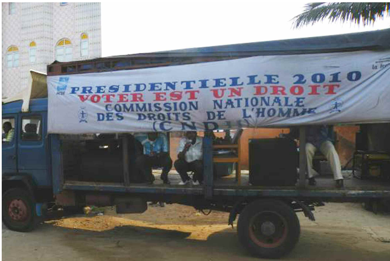
SENSIBILISATION AU DROIT DE VOTE POUR L'ÉLECTION PRÉSIDENTIELLE DE 2010