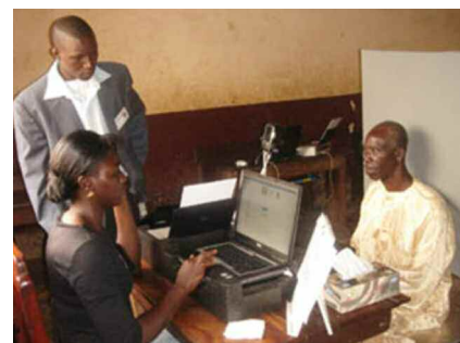
RÉVISION DES LISTES ÉLECTORALES

Dans le souci de sécuriser le processus électoral en cours dans le pays, le gouvernement, réuni en Conseil des ministres, le 11 novembre 2009, a pris un décret portant création de la Force sécurité élection présidentielle (FOSEP 2010). Cette force de 6 000 hommes, composée de 3 000 policiers et de 3 000 gendarmes, a vu le jour le 16 novembre 2009. Elle a pour mission de sécuriser le processus électoral avant, pendant et après le scrutin et de garantir un climat de paix sur l'ensem-