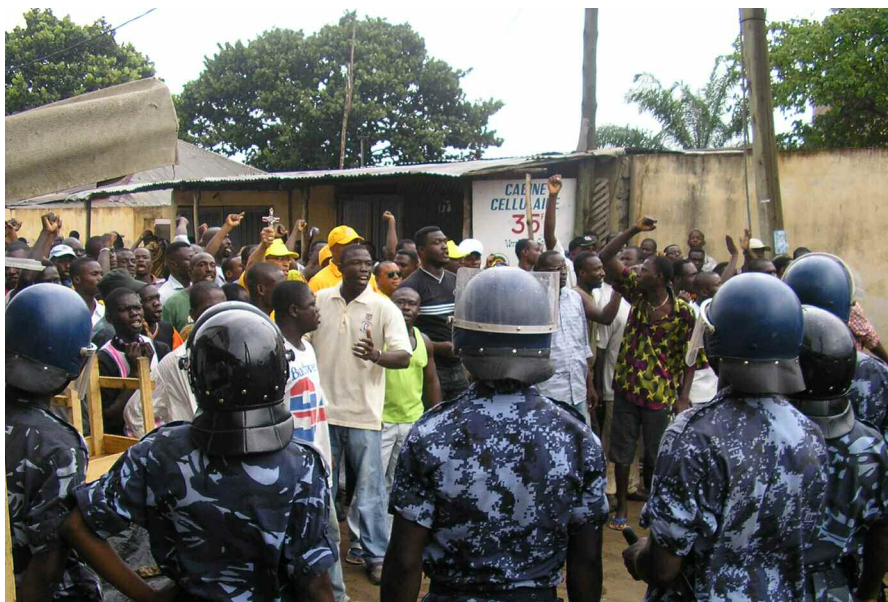
MANIFESTATION DE L'UFC EN FAVEUR D'UNE PRÉSIDENTIELLE À DEUX TOURS

Aussitôt installée, la CENI a commencé la mise en place des Commissions électorales locales indépendantes (CELI) dans les préfectures et les cinq arrondissements de Lomé. Ces institutions sont chargées d'organiser le scrutin au niveau local. Elles sont dirigées par des présidents de tribunaux, nom-