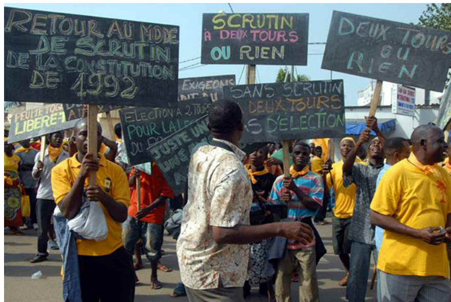
MANIFESTATION DE L'UFC EN FAVEUR D'UNE PRÉSIDENTIELLE À DEUX TOURS

EN DÉPIT DES EFFORTS QUE LE GOUVERNEMENT DÉPLOIE POUR CRÉER LES CONDITIONS D'UNE ÉLECTION PRÉSIDENTIELLE ACCEPTABLE PAR TOUS, DES QUESTIONS ÉPINEUSES QUI NE TROUVENT PAS ENCORE DE RÉPONSE CONTINUENT D'ALIMENTER LE DÉBAT POLITIQUE : LE MODE DE SCRUTIN.