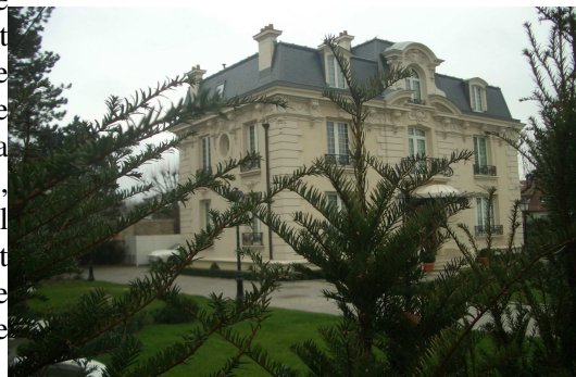
Villa Suzette (Le Vesinet)

De plus, si on se réfère au travail accompli par des citoyens congolais sur les biens mal acquis « des nouveaux riches congolais », on découvre que beaucoup de ses proches possèderaient des propriétés dans la région parisienne. Ainsi, son neveu Wilfrid, qu'il a nommé conseiller politique et qui dirige la société congolaise des transports maritimes (Socotram), posséderait un appartement de 550m 2 avec une belle terrasse de 100m 2 . Le neveu du président congolais aurait aussi un faible pour les voitures de luxe : Porsche, Mercedes, BMW, Jaguar et une Aston Martin DB9 auraient leur place dans les sous-sols de l'immeuble. 355 Le frère du président, PDG d'une compagnie pétrolière Likouala SA, plusieurs fois mise en cause par la justice, posséderait une propriété à Argenteuil. Son neveu, directeur du domaine présidentiel, posséderait un bel appartement dans le 16 ème arrondissement à Paris. La liste est longue et hormis la famille de Sassou-Nguesso, elle révèle de nombreux biens au Congo ou en France, détenus par l'entourage du président congolais et des hauts fonctionnaires congolais.