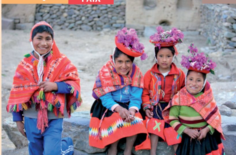
Alex E. Proimos, Pérou 2009 © www.flickr.com

Action catholique des enfants (ACE) • Action catholique des femmes (ACF) • Action catholique des milieux indépendants (ACI) • Action catholique ouvrière (ACO) • Chrétiens dans le monde rural (CMR) • Coopération missionnaire (OPM) • Chrétiens dans l'enseignement public • Communauté Vie Chrétienne (CVX) • Délégation catholique pour la coopération (DCC) • Instituts Religieux et Solidarité Internationale (IRSI) • Jeunesse étudiante chrétienne (JEC) • Jeunesse indépendante chrétienne (JIC) • Jeunesse indépendante féminine (JICF) • Jeunesse mariale (JM) • Jeunesse ouvrière chrétienne (JOC/JOCF) • Mission de la Mer • Mouvement chrétien des cadres et dirigeants (MCC) • Mouvement chrétien des retraités (MCR) • Mouvement du Nid • Mouvement eucharistique des jeunes (MEJ) • Mouvement rural de jeunesse chrétienne (MRJC) • Pax Christi • Scouts et Guides de France • Secrétariat général de l'Enseignement catholique (SGEC) • Secrétariat national pour l'évangélisation des jeunes, scolaires et étudiants, Aumôneries étudiantes • Service National de la Pastorale des Migrants (SNPM) • Société de Saint-Vincent de Paul (SVP) • Vivre ensemble l'Évangile aujourd'hui (VEA) • Voir ensemble.