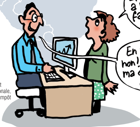
Bill dirigeant de multinationale, échappe à l'impôt