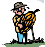
Diego paysan guatémaltèque, vend sa banane

Les premiers utilisateurs des paradis fiscaux sont les entreprises multinationales qui évadent leurs bénéfices et capitaux : elles génèrent plus de 60 % des richesses concentrées dans ces territoires. Comment ? Les maisons mères des multinationales multiplient leurs filiales dans les paradis fiscaux, puis elles manipulent leur comptabilité pour faire artificiellement apparaître les profits dans ces filiales non imposées. Les richesses peuvent donc ne pas être enregistrées là où elles sont véritablement créées ! En s'enrichissant de la sorte, les multinationales opèrent une véritable déconnexion des activités financières de l'économie réelle : elles deviennent elles-mêmes source d'opacité.