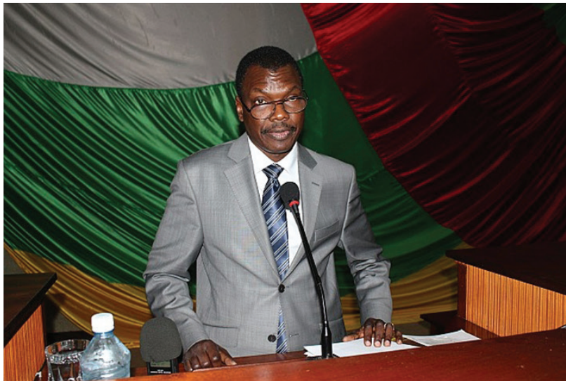
Financement Angolais : le Premier Ministre centrafricain, Mahamat Kamoun face au conseil de transition

C'était ainsi un curieux raccourci sur l'une des dimensions de la crise centrafricaine : bien plus que les montants comptables, appréciables pour la RCA mais modestes pour un pays en état de marche, c'était cette morgue, cet égocentrisme et ce manque d'empathie et de solidarité avec un peuple qui souffrait qu'il fallait pointer. Le silence des internationaux soulignait que peut-être les mouvements armés n'avaient pas tort sur tout.