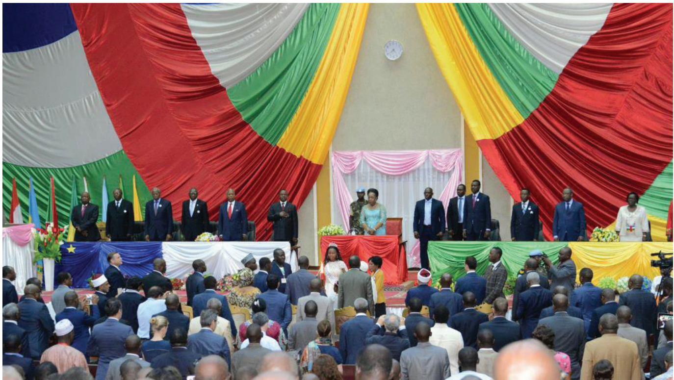
Catherine Samba-Panza, la présidente de la transition lors de la clôture du Forum de Bangui en mai 2015