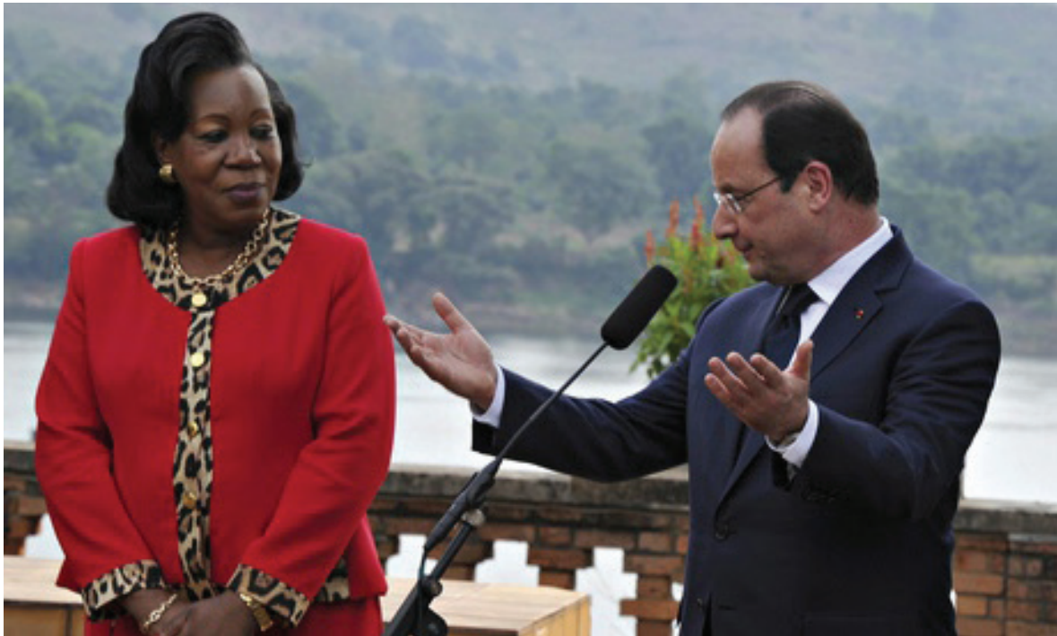
Catherine Samba-Panza et François Hollande, président de la République française en 2014