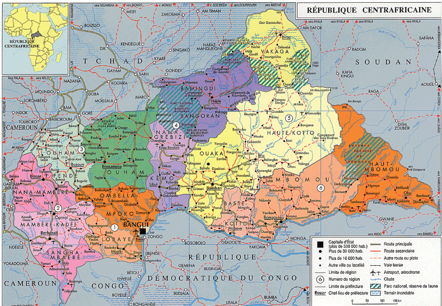
Carte de la République centrafricaine