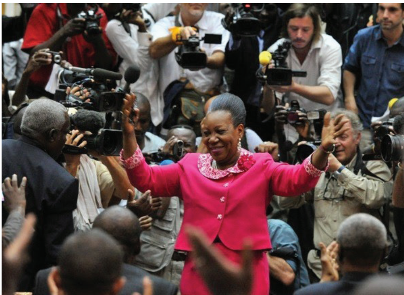
Catherine Samba Panza après son élection le 20 janvier 2014