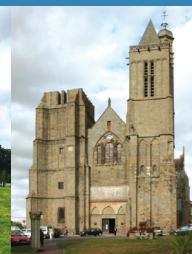
5 Cathédrale de Dol