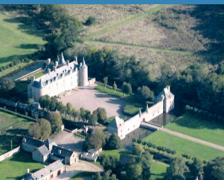
1 Château de Bienassis