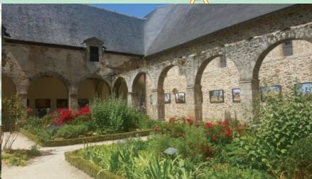
7 Abbaye Saint-Magloire de Léhon