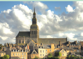
6 Église Saint-Sauveur, Dinan