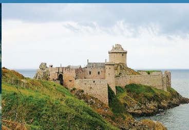
2 Fort La Latte