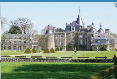
3 Château de la Bourbansais