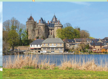
9 Château de Combourg