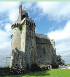
8 Château de Montmuran