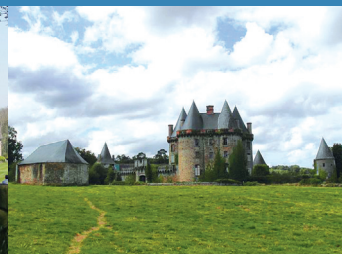
4 Château de Landal