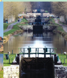
10 11 écluses, Hédé